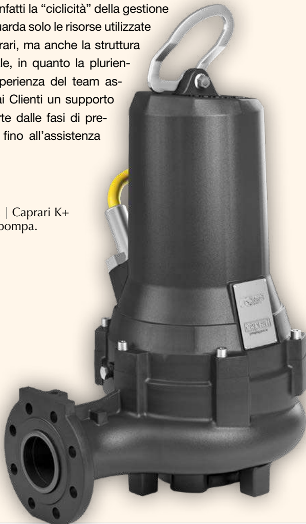
Figura 2 | Caprari K+ Energy pompa.

Tra le principali attività aziendali rientrano la produzione di pompe ed elettropompe all'avanguardia cui si affiancano costanti e approfonditi studi di ricerca volti a identificare nuovi supporti che favoriscano una gestione dell'acqua sempre più completa e monitorata. Infatti la "ciclicità" della gestione non riguarda solo le risorse utilizzate da Caprari, ma anche la struttura aziendale, in quanto la pluriennale esperienza del team assicura ai Clienti un supporto che parte dalle fasi di pre-vendita fino all'assistenza